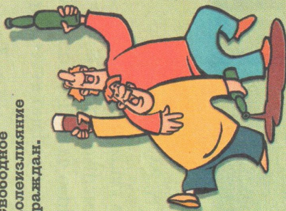
ИЛЛЮСТРАЦИЯ: © АНДРЕЙ ДОРВНОВ

Если вы услышали в радио- или телепередачах, заметили в газете или журнале ошибки в произношении или употреблении слов, выражений, присылайте свои замечания по адресу: 117218, Москва, а/я 8, «Ридерз Дайджест». Не забудьте на конверте пометить: «В рубрику «Слово не воробей»».