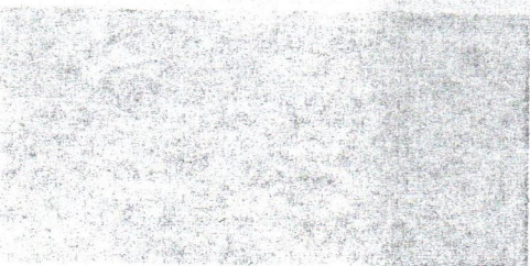
В. Г. Белинский. Портрет И. Е. Репина. Из собрания Музея-квартиры В. Г. Белинского в Ленинградском государственном университете.

ческие выпады против самого Виссариона Григорьевича. Сочетание «портреты Репина» тоже не кажется нам двусмысленным, так как мы знаем И. Е. Репина как великого портретиста... Но ведь и другой художник мог рисовать его. В этом случае правильнее будет сказать «портрет Репина».