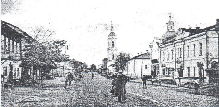
г. Дорогобужь. Московская улица.

– Что они говорят такое, какую тарабарщину? – спросил меня знакомый.