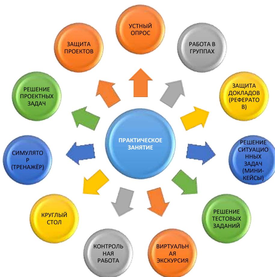
Рисунок 2. Виды практических занятий в системе среднего профессионального образования.

Среди наиболее часто встречающихся в педагогической практике можно выделить следующие виды практических занятий: устный опрос, работа в группах, защита докладов (рефератов), решение ситуационных задач (миникейсы), решение тестовых заданий, виртуальные экскурсии, контрольные работы, круглые столы, симуляторы (тренажёры), решение проектных задач, защита проектов и т.д. (Рисунок 2).