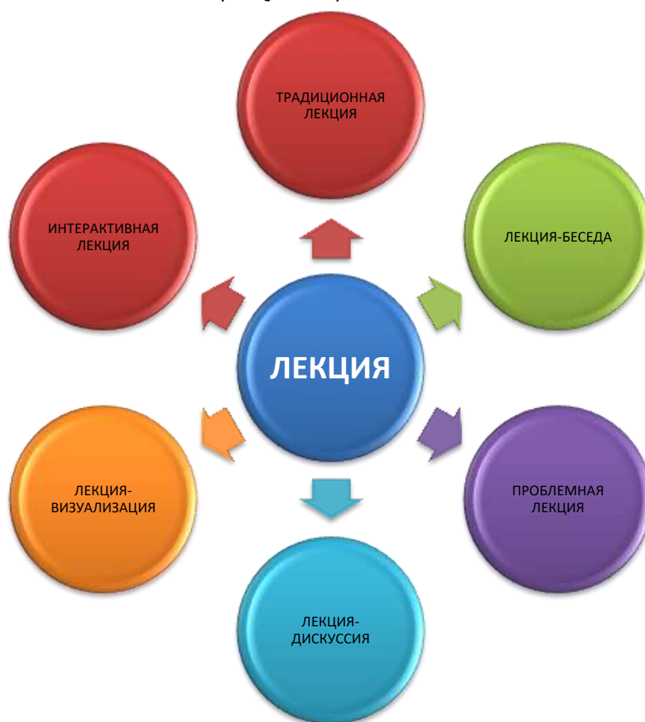
Рисунок 1. Виды лекций в системе среднего профессионального образования.

Анализ практики обучения в образовательных организациях среднего профессионального образования показывает, что преподаватели в своей практике наиболее часто используют: вводные лекции, традиционные лекции, лекции-беседы, проблемные лекции, лекции-дискуссии, лекции-визуализации, интерактивные лекции и т. д. (Рисунок 1).